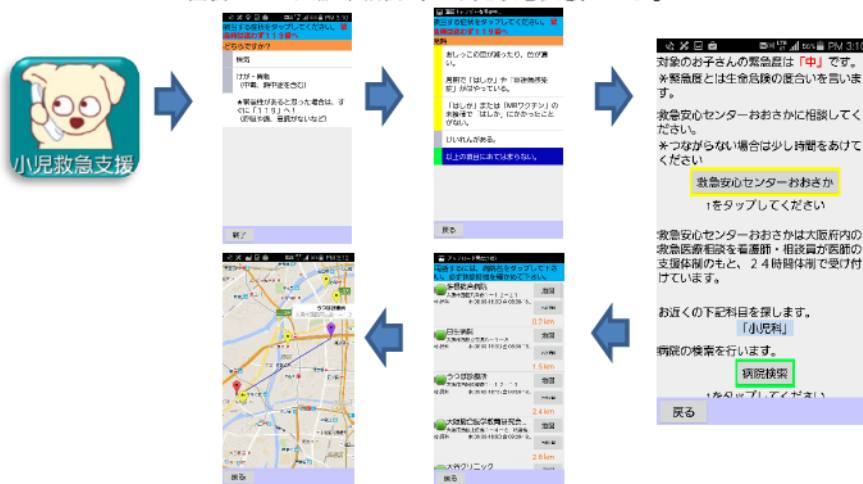
図表 3-71 大阪市消防局「小児救急支援アプリ」

大阪市消防局では、小児の緊急度判定と医療機関の検索をスマートフォンでまとめて行える「小児救急支援アプリ」を開発し、平成27年9月から運用を開始している。このアプリでは、症状、症候を画面上で選択していくと緊急度に応じて、「119番通報」「#7119」「病院検索」の画面が表示される。緊急度が「高」の場合は119番通報と#7119、「中」の場合は#7119と病院検索、「低」の場合は病院検索がワンタッチで可能となる。病院検索については、GPS機能がオンのときに近くの受診可能な医療機関が案内され、ワンタッチで電話が可能となり、医療機関までの経路が表示される。なお、このアプリのうち、緊急度判定については、他地域においても使用可能となっている。