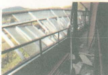
（大分合同新聞平成28年4月17日朝刊掲載）