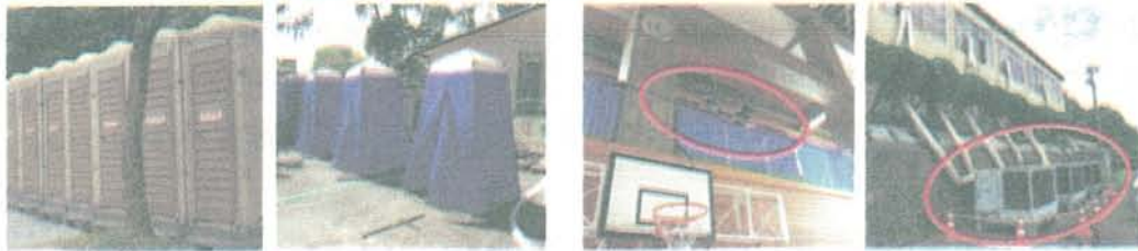
トイレ（左：仮設トイレ、右：マンホールトイレ）

汲取りの処理、照明、和式等の問題があり、マンホールトイレの設置を求める声があった。