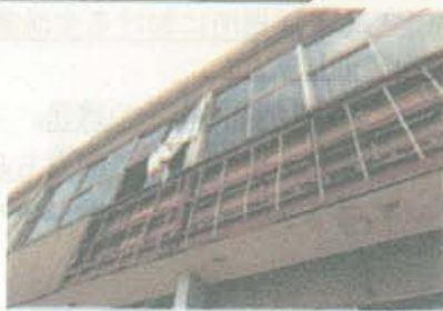
<経年劣化したラスモルタルによる外壁（湿式外壁）の落下（体育館）>