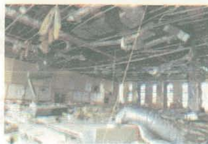
<最上階ホール天井の脱落（校舎）>